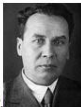
Г. Кошкин М.И. Д.